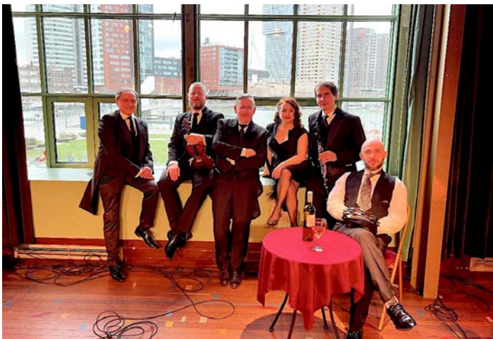
Benefiet voor de aardbeving in Turkije door het Tombaz Ensemble

jaar). Ruim 50% van de pashouders waren voor Walhalla nieuwe bezoekers. Doordat het inboeken van kaarten nog niet is geautomatiseerd, is het nog wel arbeidsintensief. Voor studenten gold een vaste prijs van €10 op de dag zelf (op vertoon van studentenkaart aan de kassa). Gedurende het jaar vonden we dat we veel jong publiek uitsloten door het ‘studentenkorting’ te noemen en daarom wijzigden we de voorwaarden in ‘iedereen t/m 25 jaar’. Wat echter het meeste opleverde was om de jongerenprijs op de dag zelf online beschikbaar te maken, waardoor jongeren vanuit huis een kaart konden bestellen. In 2023 is er bijna 100 keer een kaartje verkocht met deze jongerenprijs. 50% hiervan was nieuw publiek voor ons. Om jongvolwassenen meer aan te spreken wijzigden we het genre ‘toneel’ bovendien in ‘theater’. In december is een fotobooth aangeschaft waaruit de bezoekers gratis een stripje foto’s meekrijgen als aandenken aan hun bezoek.