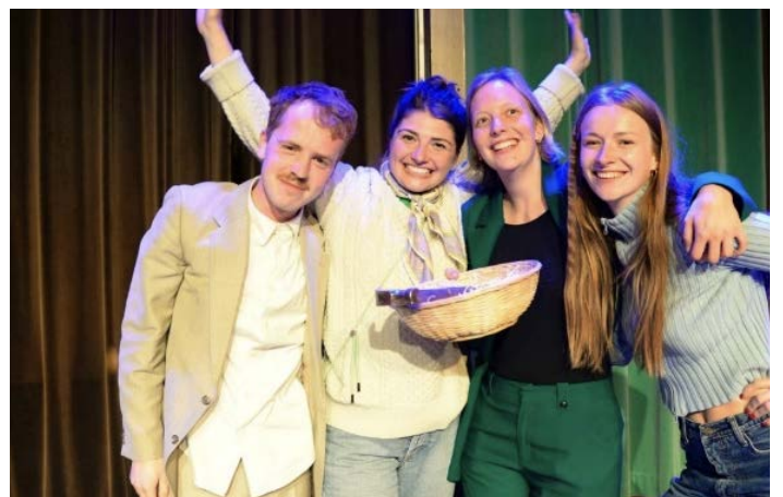
Schwung , winnaars van de Werkplaats Walhalla Pitch 2023