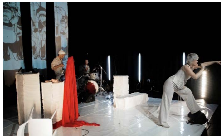
Scènefoto uit Op de Barricade van het Hart