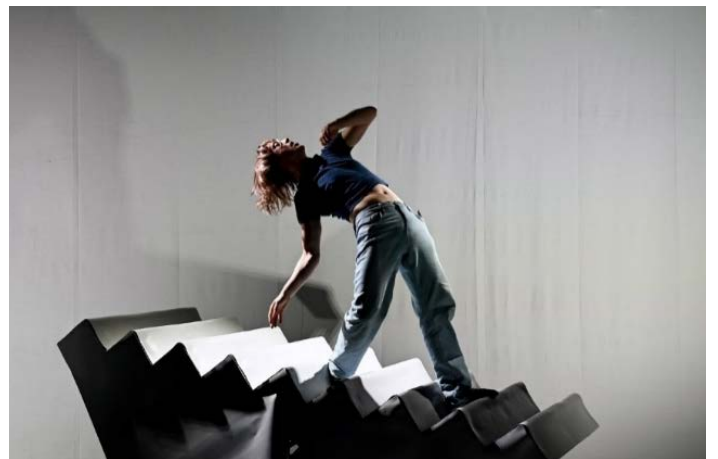
Scènefoto uit Johnny