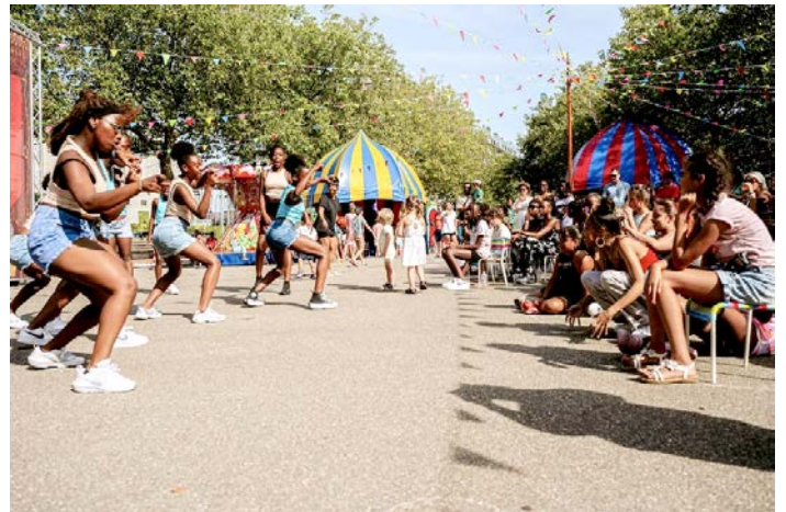
Optreden door dansgroep DC Squad tijdens Walhalla's Verjaardagsfeest

In het tweede weekend van september bestond Theater Walhalla officieel 15 jaar. We vierden dat op zondag met een gratis buurtfestival voor het hele gezin op het versierde Deliplein. Die dag was het 32 graden. Gelukkig zorgden de bomen rond het plein voor genoeg schaduw. Er was een draaimolen, een Walhalla-museum, een marcherende mini-fanfare, acts van kunstenaars Maarten Bel en Studio Maky, een dansworkshop, er werd geschminkt en voorgelezen door Ma'Ma Queen, er waren twee textielworkshops door Platform Katendrecht en natuurlijk was er een podium met heel veel optredens van artiesten en groepen uit Rotterdam(-Zuid). We trakteerden op een gratis taartje en reikten aan onze vrijwilligers van het eerste uur een erepenning uit. Het festival werd afgesloten met de ritme-formatie 4 BEAT, die erin slaagde het oververhitte publiek toch nog in beweging te krijgen.