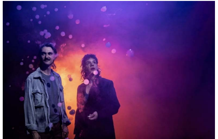
Scènefoto uit Life Actually