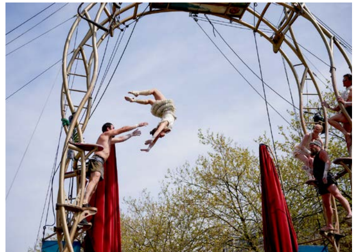
Les Ptits Bras op het Circusstad Festival op Katendrecht